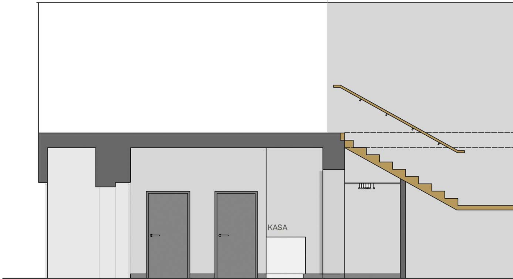
Widok sciana A-A