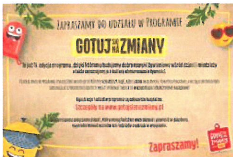
Zaproszenie.jpg ~175 KB